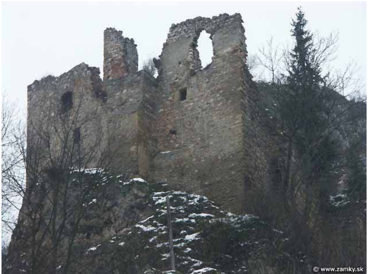
Lednice vára napjainkban